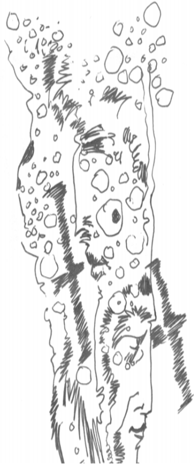
(باخهوان له پيچهوانه خويدا)

بو خودا يه كه مين باخهوان بو باوكم كه باخهوانى دايكمه بو خووم كه باخهوانى كچه كه مم پالم داوه بهم تاريكيه وه باخهوان پيم نه لئيت: به لام تو پروناكيت له پيشه به لام من تاى نووريكم لى هاتووه كه ده لئين به يانى دى و كوتوپر شهوت تيا نه ته كي نييت! دلم داوه بهم تاريكيه وه دهستم وهك دهستى باخهوان به شهره فى باخچه وه نه له رزيت تاى تاريكيه كم لى هاتووه كه ده لئين ئيواره دى و به يانى و لى نه فرينييت! به گومانه وه وه ستاوم له نيوان جهنگى دوو ئاوينه دا كه نه م سهره وسهرى شتيكيان ليوه دياره باخهوان پيم نه لئيت: ئاوينه ي تو له تاريكى مندا نه دره وشيته وه نه وه خته ي زيان وهك بى حيشمه تترين سوزانى له بيري نه چيته وه له كويدا جى هيشتووى دنيا وهك سيويكى گه نيوو نه له باخه كانى منا و نه له باخه كانى سينه ي تو وا له ره ي نايه!